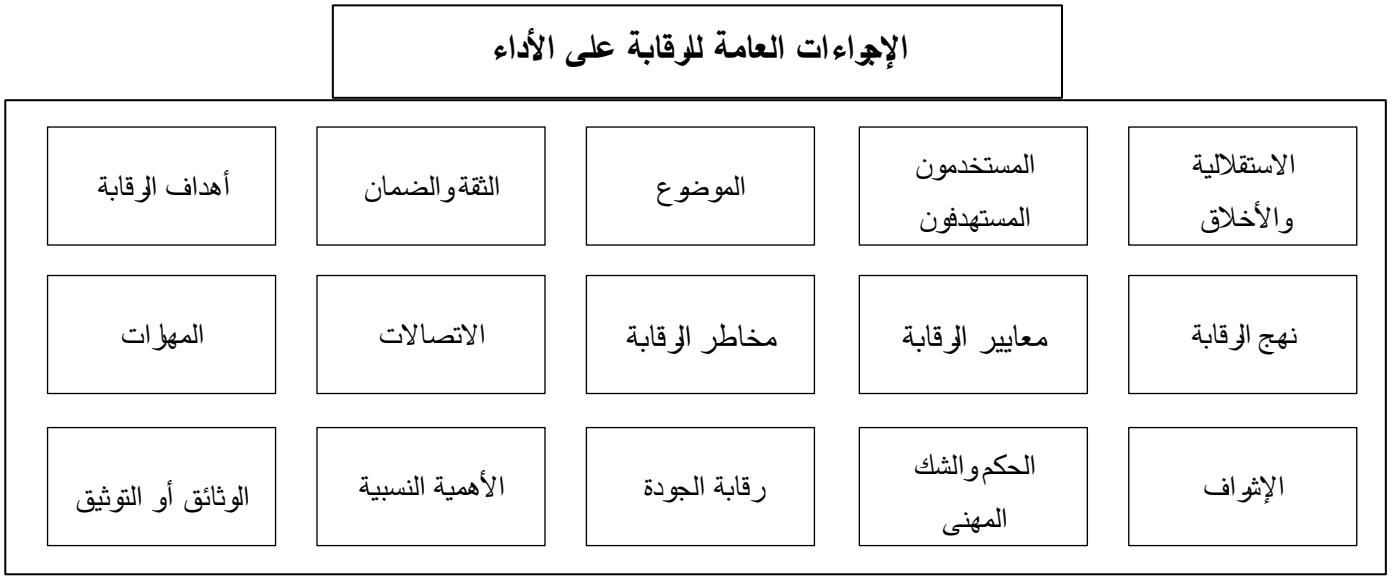
شكل (1-2) الإجراءات العامة والخاصة المتعلقة بعملية الرقابة على الأداء